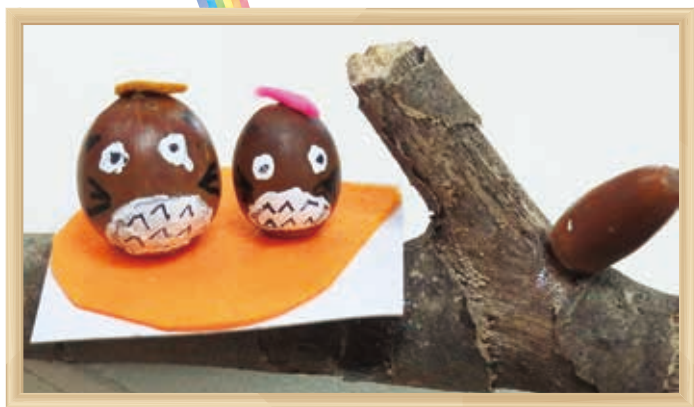
はるさと もり きょういく かた かい さくひん 春里の森 教育を語る会さんの作品

きよねん 去年のクリスマスリースにも使いました。 こうえん 公園のどんぐりを枯れ枝につけて飾りました。